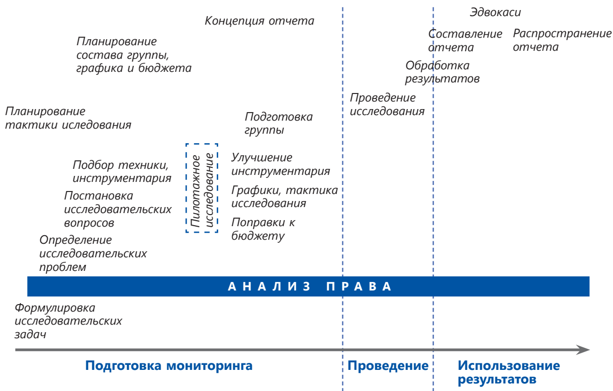
Диаграмма 1. Этапы мониторинга 2

Несмотря на то, что мониторинг прав человека может иметь различный фокус, который и будет определять его особенности, существует общий алгоритм действий при подготовке любого мониторинга, который следует соблюдать 1 (см. диаграмму 1).